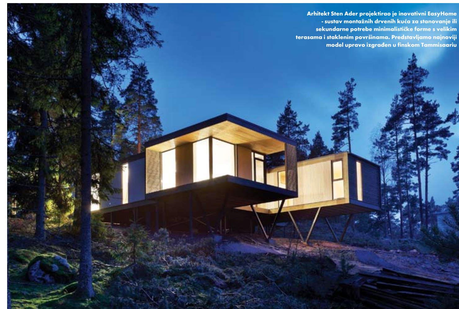
Arhitekt Sten Ader projektirao je inovativni EasyHome - sustav montažnih drvenih kuća za stanovanje ili sekundarne potrebe minimalističke forme s velikim terasama i staklenim površinama. Predstavljamo najnoviji model upravo izgrađen u finskom Tammisaari

Estonski dizajn moguća je nova kolijevka za rast tendencija koje se već primjećuju u suvremenom dizajnu. Već dulje vrijeme razvijano zasićenje ljudi proizvodima tehnološke savršenosti, unificiranosti i globalne dostupnosti izlilo se kao kap preko čaše ekonomskom krizom koja je dotadašnju žed za savršenstvom zamijenila skromnošću i potrebu za ručno izrađenim predmetima inovativnog dizajnerskog predznaka