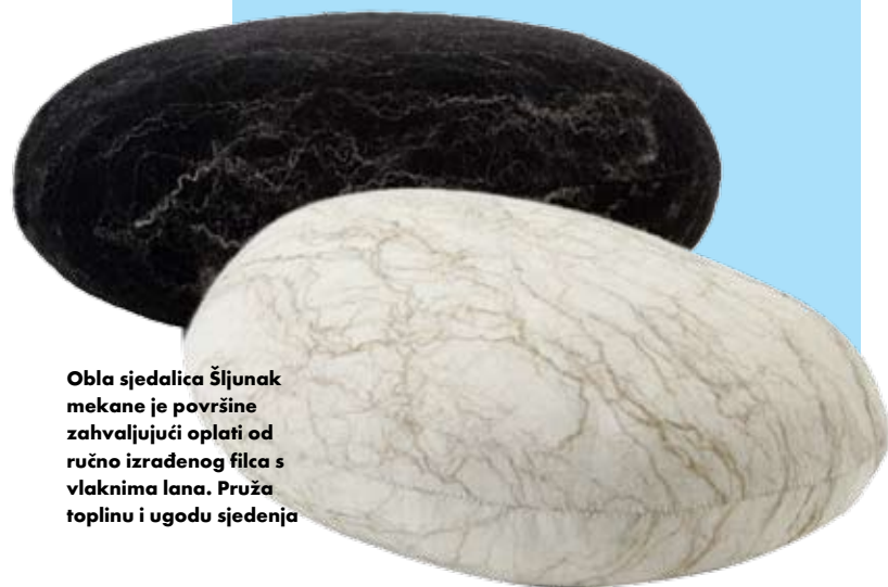
Obla sjedalice Šljunak mekane je površine zahvaljujući oplati od ručno izrađenog filca s vlaknima lana. Pruža toplinu i ugodu sjedenja

U posljednjih nekoliko godina Anni Laigo razvila je istoimeni brend u sklopu kojeg je dizajnirala niz rješenja za interijere - od zavjesa, svjetlećih tepiha, stolnjaka i garnitura za sjedenje. Među potonjima ističe se obla sjedalice Šljunak, inspirirana morskom obalom. Unutrašnjost joj je umalo tvrda poput kamena zahvaljujući kalupu od poliuretanske pjene, no njezinoj mekoći i ugodni sjedenja pridonosi oplata od ručno izrađenog filca s umetnutim vlaknima lana.