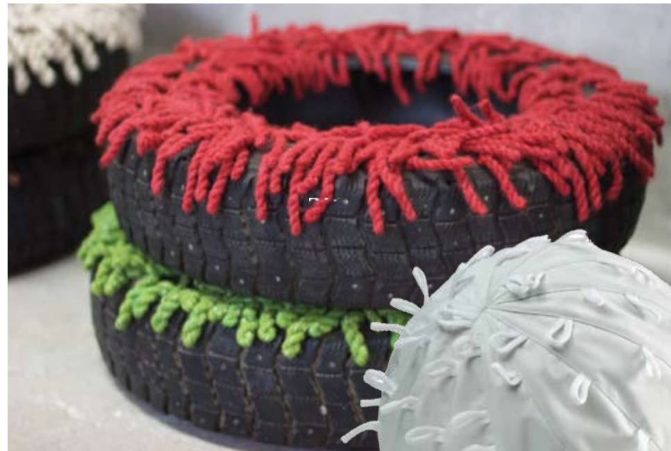
GORE: gumeni kotač postaje sjedalica Kruss opšivena vunom. DESNO: lopta za sjedenje Cosmos višestruko je uporabiva u interijeru. Na njoj se može sjediti, skakati i dekorirati prostor. Vanjski je dio periv i lagano se skida. SASVIM DESNO: drveni tepih Floor povezan je vunanim nitima u ornament Seto čipke