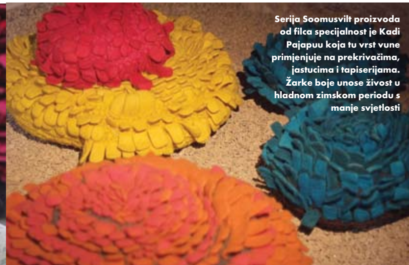
Seriya Soomusvilt proizvoda od filca specijalnost je Kadi Pajapuu koja tu vrst vune primjenjuje na prekrivačima, jastucima i tapiserijama. Žarke boje unose živost u hladnom zimskom periodu s manje svjetlosti