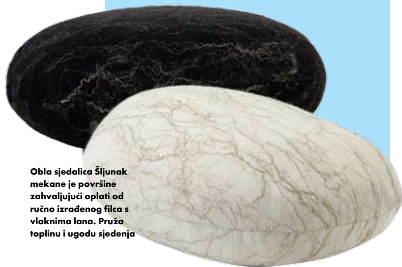
Obla sjedalica Šljunak mekane je površine zahvaljujući oplati od ručno izrađenog filca s vlaknima lana. Pruža toplinu i ugodu sjedenja

U posljednjih nekoliko godina Annike Laigo razvila je istoimeni brend u sklopu kojeg je dizajnirala niz rješenja za interijere - od zavjesa, svjetlećih tepiha, stolnjaka i garnitura za sjedenje. Među potonjima ističe se obla sjedalica Šljunak, inspirirana morskom obalom. Unutrašnjost joj je umalo tvrda poput kamena zahvaljujući kalupu od poliuretanske pjene, no njezinoj mekoći i ugodni sjedenja pridonosi oplata od ručno izrađenog filca s umetnutim vlaknima lana.