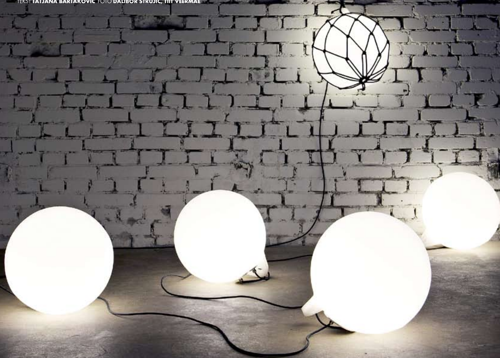
Lampa Buoy inspirirana je oblikom bove u tešniji razvoja voodopornog rasvjetnog tijela. Jednako je prigodan za interijer kao i javne površine. Dizajn: Margus Triibmann

TEKST TATJANA BARTAKOVIĆ